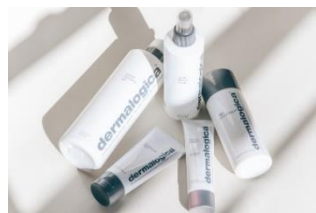
dermalogica PRO ®

髪、皮膚、気もちをひとつながりで美しく。ヘッドスパを頂点に「全身のつながりあった健康美」を引き出し高めるホリスティックビューティブランドです。